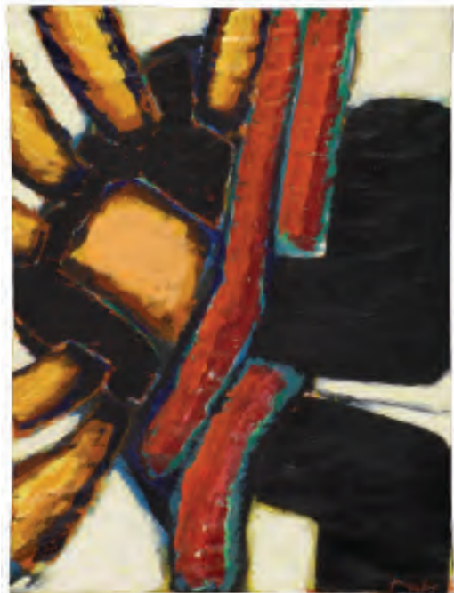
„ohne Titel“, 2005