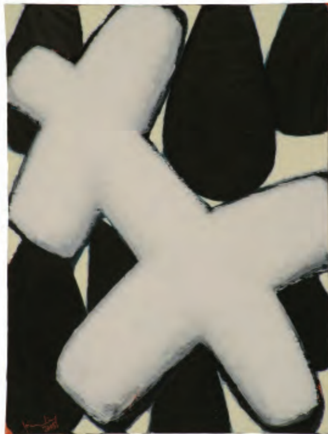
„ohne Titel“, 2005