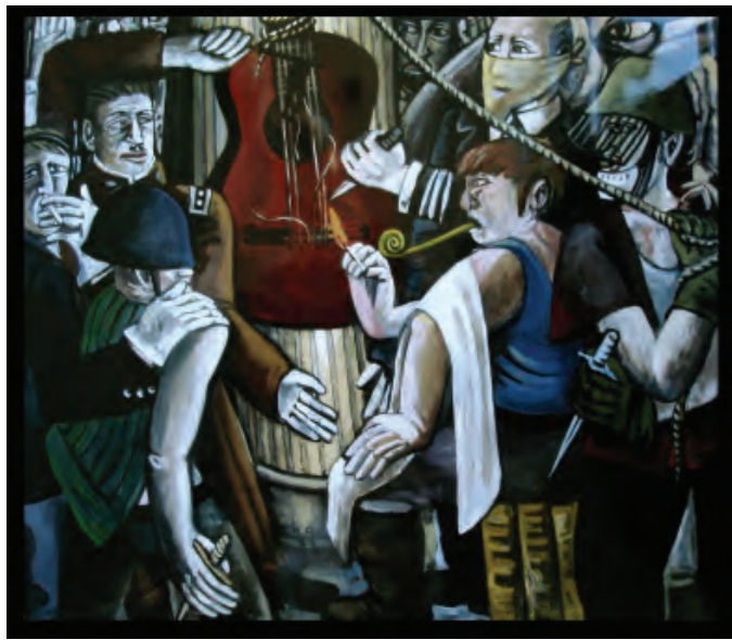
„Juntamusik“, 1973, Museum der Bildenden Künste Leipzig

„Der Künstler ist immer ein Argonaut. Er zieht mit seiner Kunst in Imaginationen aus, um etwas heimzuholen. Kunst ist immer ein Wegfahren in eine Distanz zur Gegenwart. Sie lebt von der Hoffnung, dieses Sichwegbewegen bekäme den Sinn eines klareren Blicks auf den Ort des Bleibens. Der Künstler ist unterwegs mit der Behauptung: Ich finde die Wahrheit.“