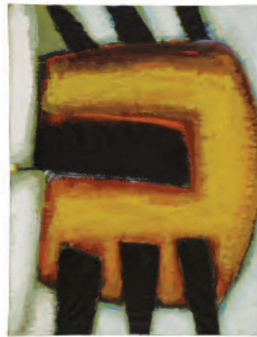
„ohne Titel“, 2005