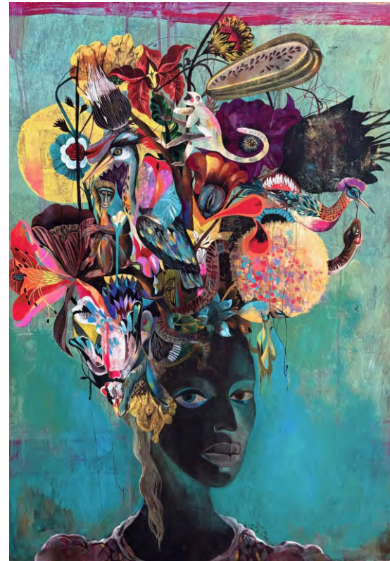
Abbildung oben: limited Edition Print „Antoinette/ Strange Flowers“

Titel und Rückseite unter Verwendung der Illustrationen für das Buchcover von „Olaf Hajeks fantastische Früchte“, Prestel Verlag, 2022