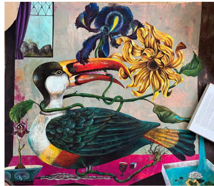
Abbildungen von links nach rechts: Der Wächter des Gartens, Acryl auf Leinwand; Strange Flowers, Acryl auf Leinwand; Majestät, Acryl auf Leinwand; Rote Bete, Acryl auf MDF