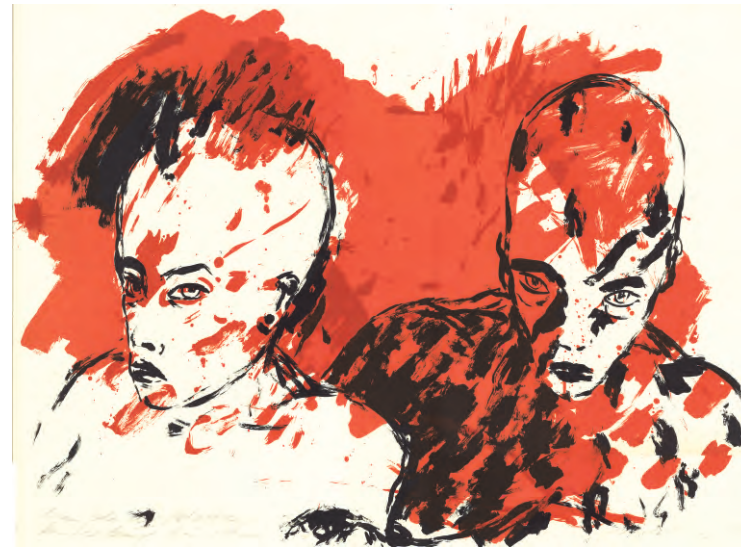
Angela Hampel, Meine beiden Schatten, kunterbunt bin ich, Farbalgrafie