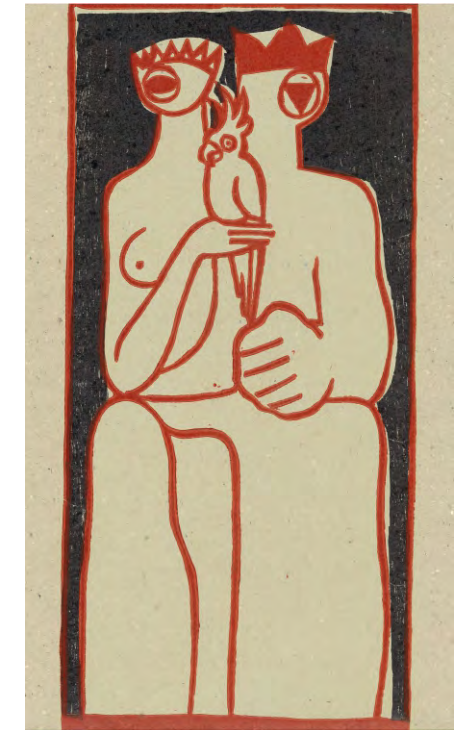
Abbildung oben: Max Uhlig, Kleines Selbstporträt, Lithografie Abbildung unten: Wieland Schmiedel, König und Königin,