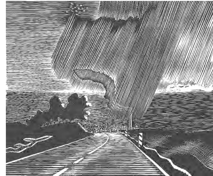
Wolfgang Mattheuer, Regenschauer, Holzschnitt